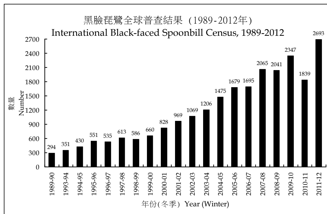
圖 1：1989-90 至 2011-12 年冬季的全球黑臉琵鷺數量